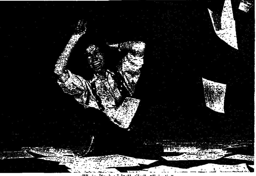
ابنا وتونكات البيانو المبعثرة - نسخة من القلب

وقال مدير المركز ميشال لا شر ان الاربعة في مدينة كوكبانو (بريواتيا) الفرنسية.